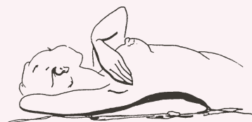
2. Non tralasciare la palpazione dell'ascella