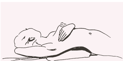
1. Palpare la mammella con le dita unite e a piatto